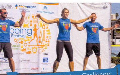
Santa Monica Trainer Challenge: YOU be the Judge! Main Stage 1:30 PM