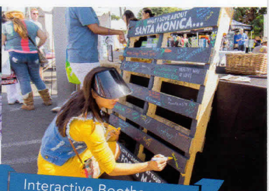
Interactive Booths with lots of Give-a-ways!

This FREE EVENT for all ages brings together our local businesses and non-profits for a fun-filled day while raising awareness about the economic, environmental and community benefits of buying local first!